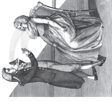
Figure 1.2: Le médium à l'œuvre

Dans tous les cas, on perdrait beaucoup en intelligibilité si l'on se contentait de disqualifier de tels émerveillements ou de telles