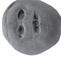
Figure 1.3: Milan Mikuláščík, reproduction 3D du galet de Makapansgat (2016)

Cela peut se comprendre bien sûr du journal télévisé, qui nous fait tous vibrer en résonance avec certaines nouvelles sélectionnées comme les plus importantes de la journée : nous y réagissons toutes et tous un peu différemment, chacun et chacune avec son contraste propre, qui produira d'autres réactions, d'autres contrastes, d'autres variations de relationalité, selon ce que nous en dirons le soir sur l'oreiller ou